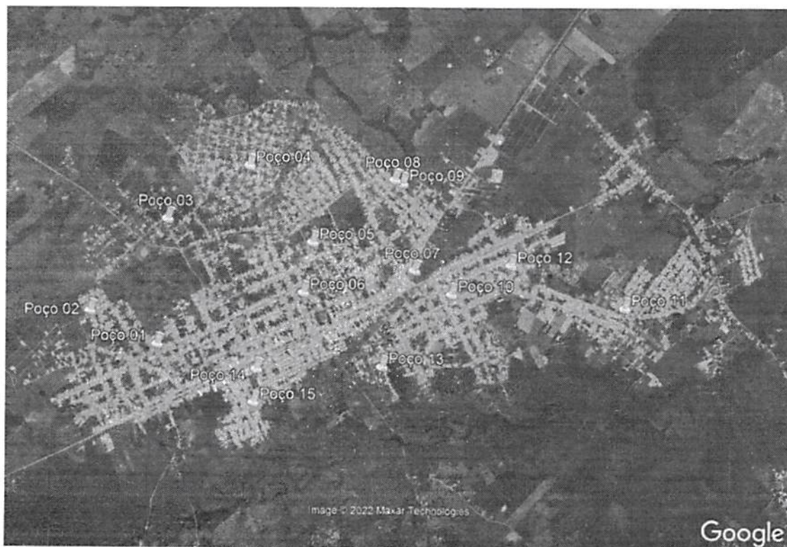
Figura 1: Localização das unidades de abastecimento (Poços e Reservatórios).

ESTADO DO MARANHÃO PREFEITURA MUNICIPAL DE SÃO MATEUS DO MARANHÃO Praça da Matriz, N°42, Centro, CEP: 65.470-000, São Mateus do Maranhão-MA CNPJ N° 06.019.491/0001-07