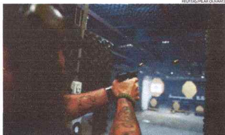
Segundo o anuário, a diminuição das mortes violentas intencionais pode ser reflexo do investimento em segurança pública, feito pelos estados e Distrito Federal

Apesar da queda nos índices, o Norte e o Nordeste ainda têm os estados mais violentos. O Amapá lidera o ranking de estado mais violento do país em 2022, com taxa de MVI de 50,6 por 100 mil habitantes, mais que o dobro da média nacional (23,4/100mil). O segundo estado mais letal foi a Bahia, com taxa de 47,1 por 100 mil habitantes, seguido do Amazonas (38,8/100 mil). Já as unidades da federação com as menores taxas de violência letal foram São Paulo, com 8,4 mortes por 100 mil habitantes, Santa Catarina, com 9,1 por 100 mil, e o Distrito Federal, com taxa de 11,3. Ao todo, 20 estados registraram taxas de MVI acima da média nacional.