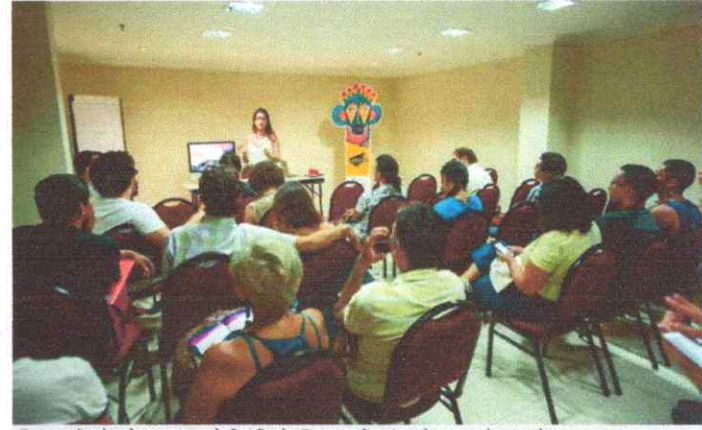
Cursos vão abordar aspectos da Lei Paulo Gustavo direcionados ao audiovisual