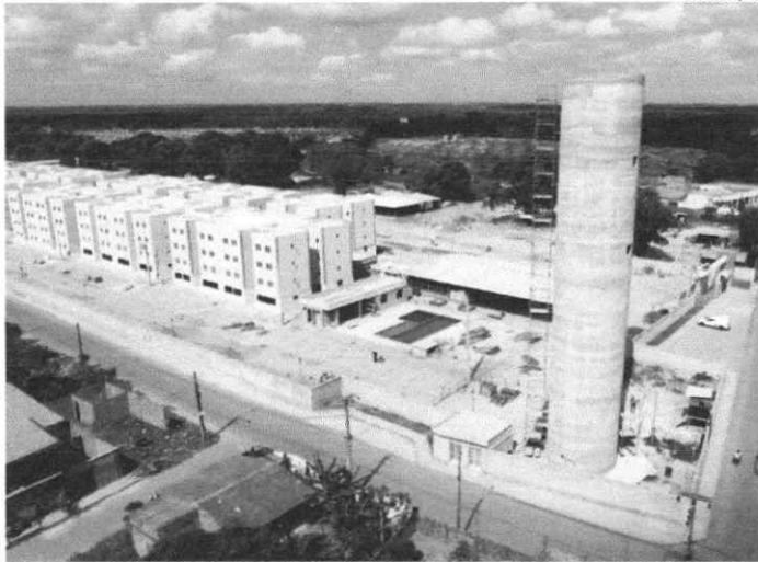
"Construa Maranhão" acontece nos dias 9 e 10 de novembro, como parte da programação da Expo Indústria