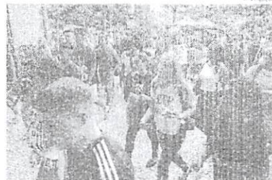
Mais de 5,7 milhões já tiveram suas inscrições confirmadas

Segundo o Inep, mais de 5,7 milhões de pessoas já tiveram suas inscrições confirmadas.