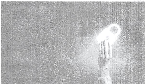
Em função da crise decorrente da pandemia, tendência é que situação se intensifique este ano

A Apura também demonstra preocupação com o aumento nos casos de ransomware, software malicioso, e se apropriação de dados e cópia resgate; e a necessidade das empresas se prepararem para evitar a contágio e proteger melhor