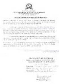
pesquisa 001.jpg 335K