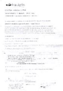
proposta 001.jpg 318K